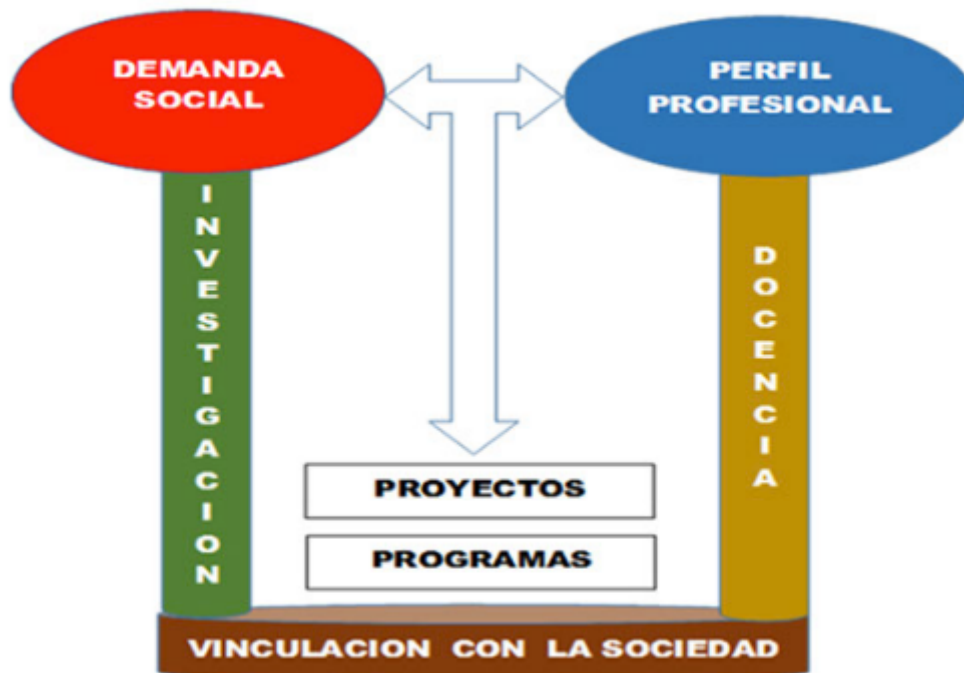
Figura No. 1 Vinculación con la Sociedad

Vinculación con la Sociedad aportan de manera significativa a la transformación de la colectividad, a través de las diferentes relaciones políticas, económicas y sociales; también se debe tomar en cuenta los principios universales como: la democracia, interculturalidad, autodeterminación, pertinencia y el bien común. (Hermida, 2015).