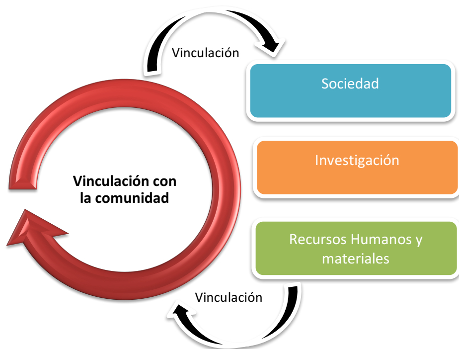
Figura No. 4 Representación espacial del Modelo de Gestión de la Vinculación con la Comunidad de la ESPEA.

Una vez realizada la indagación se procedió a desarrollar el modelo, detallado a continuación: