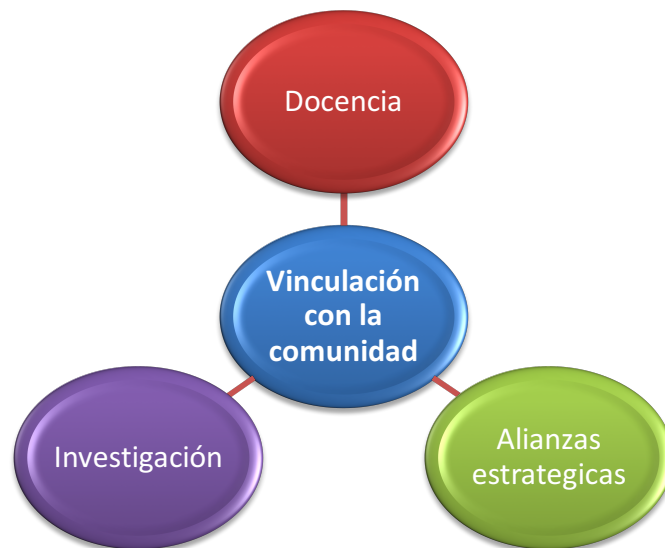
Figura No. 2 Modelo de actuación.

de encuentran las mujeres, GLBT's, niños, adultos mayores, personas con capacidades especiales, razas de interculturalidad, extranjeros, ecuatorianos en extranjero, habitantes de zonas rurales y urbano – marginales. El modelo considerado para la actuación del Instituto Tecnológico Superior de Desarrollo Humano CRE-SER, 2017 es el siguiente: