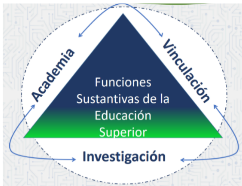
Grafico 1. Relación Docencia – Investigación – Vinculación.

Fuente: Plan de Investigación ECOTEC 2017 – 2021